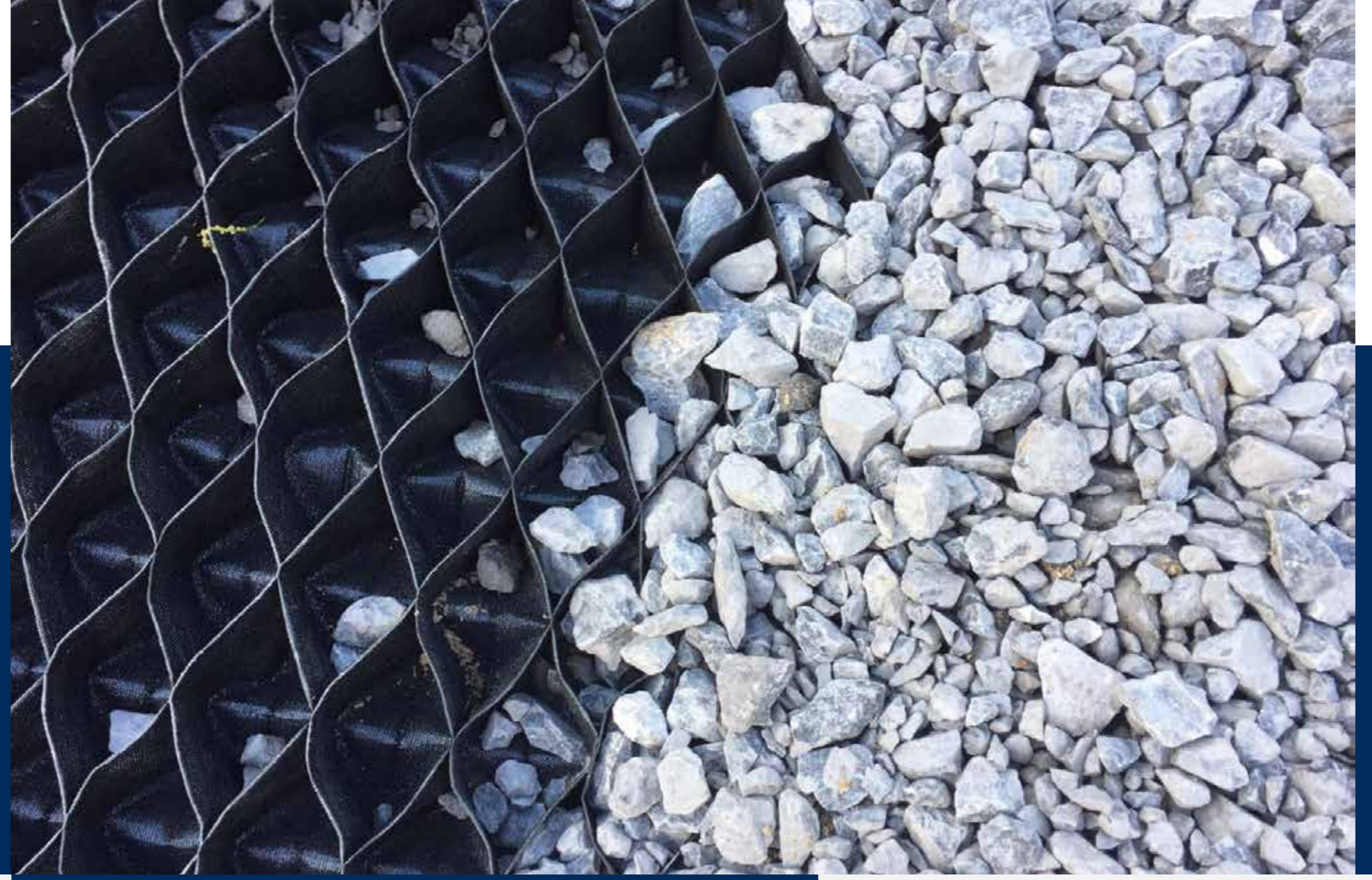
TenCate Accorder ®